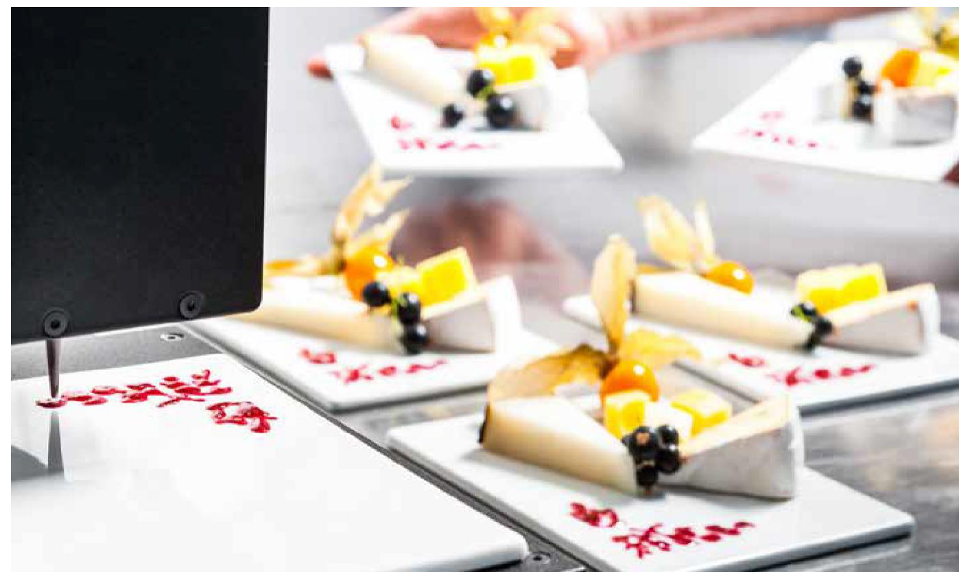
Až do 50 cassis kreácií vyrobených za 75 minutes priamo na dezertných tanieroch

- cca 1.5 minúty naattoo 1 dezertného taniera - S Procusini Cassis refill môžete vykúziť až do 105 ovocných tanierových kreácií