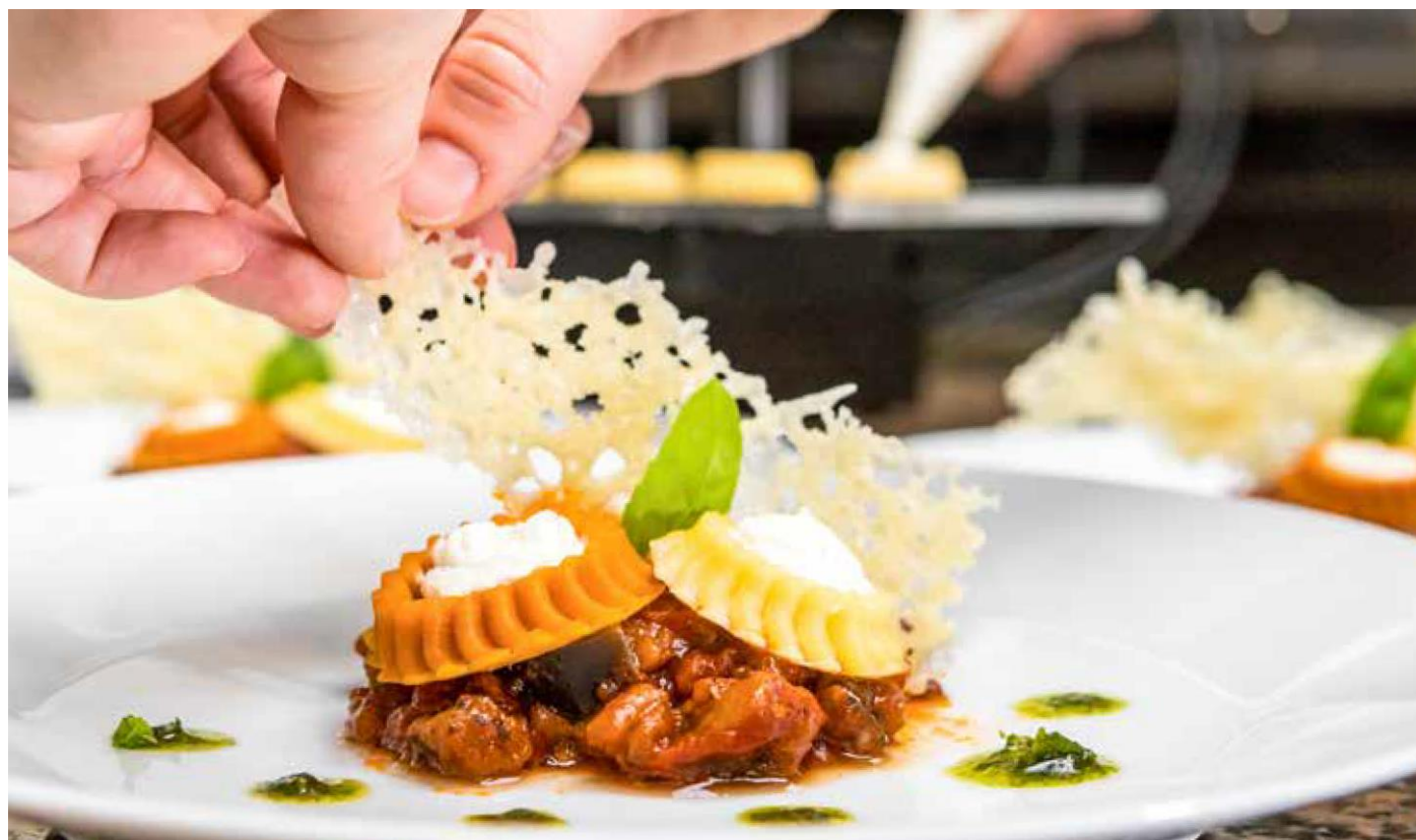
Procusini 3D Pasta - prekvapí vašich hostí neobyčajnými tvarmi vašich cestovn