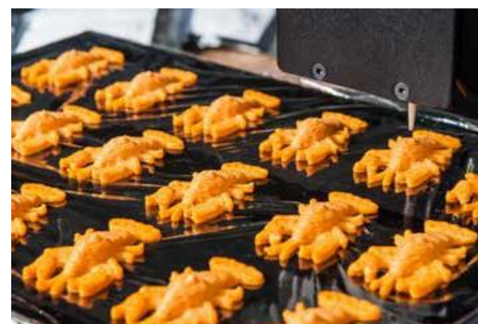
Cestovinový homár ako pastva pre oči

Procusini 3D Pasta je dostupná vo farbách natural, červená, zelená a čierna.