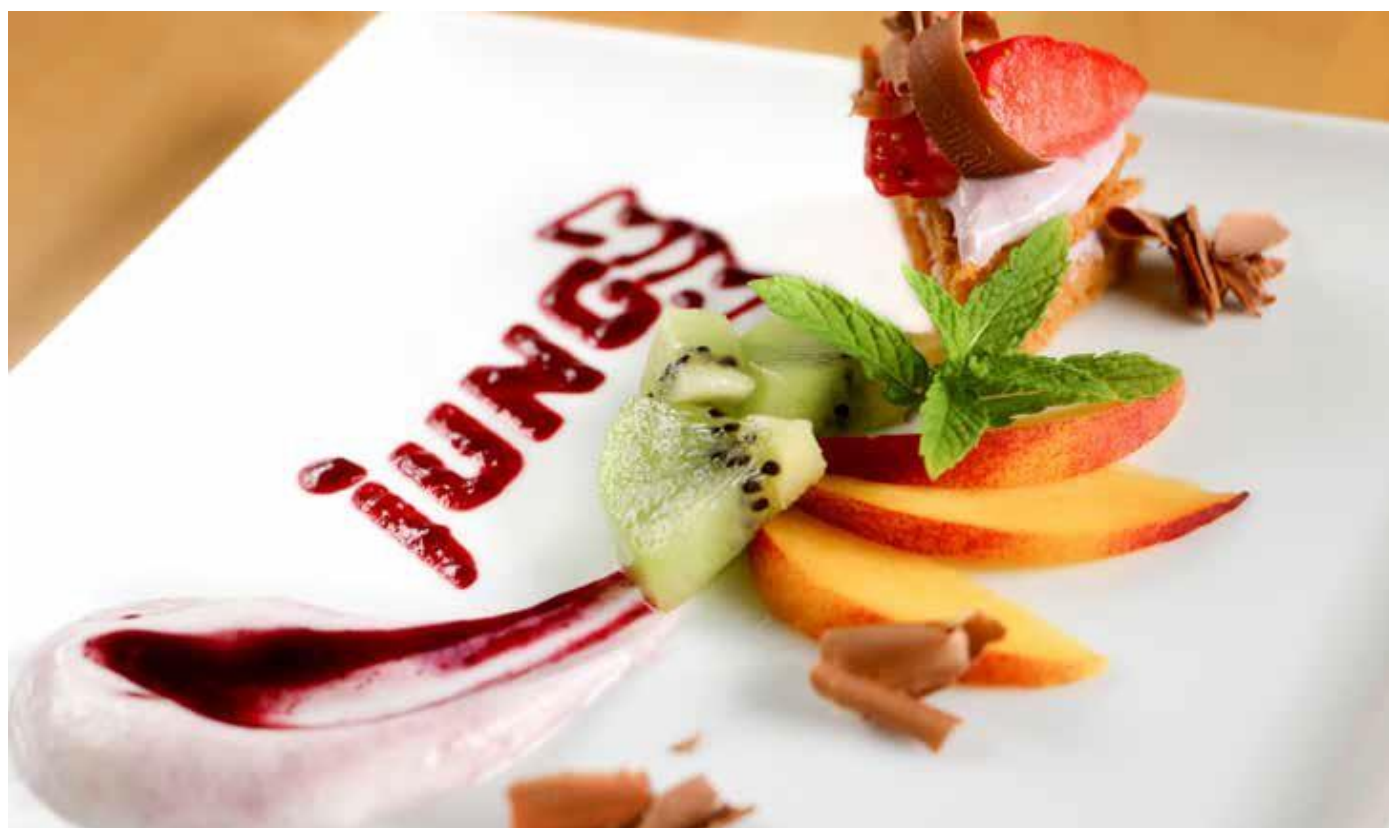
Procusini Cassis - firemné logo na dessert