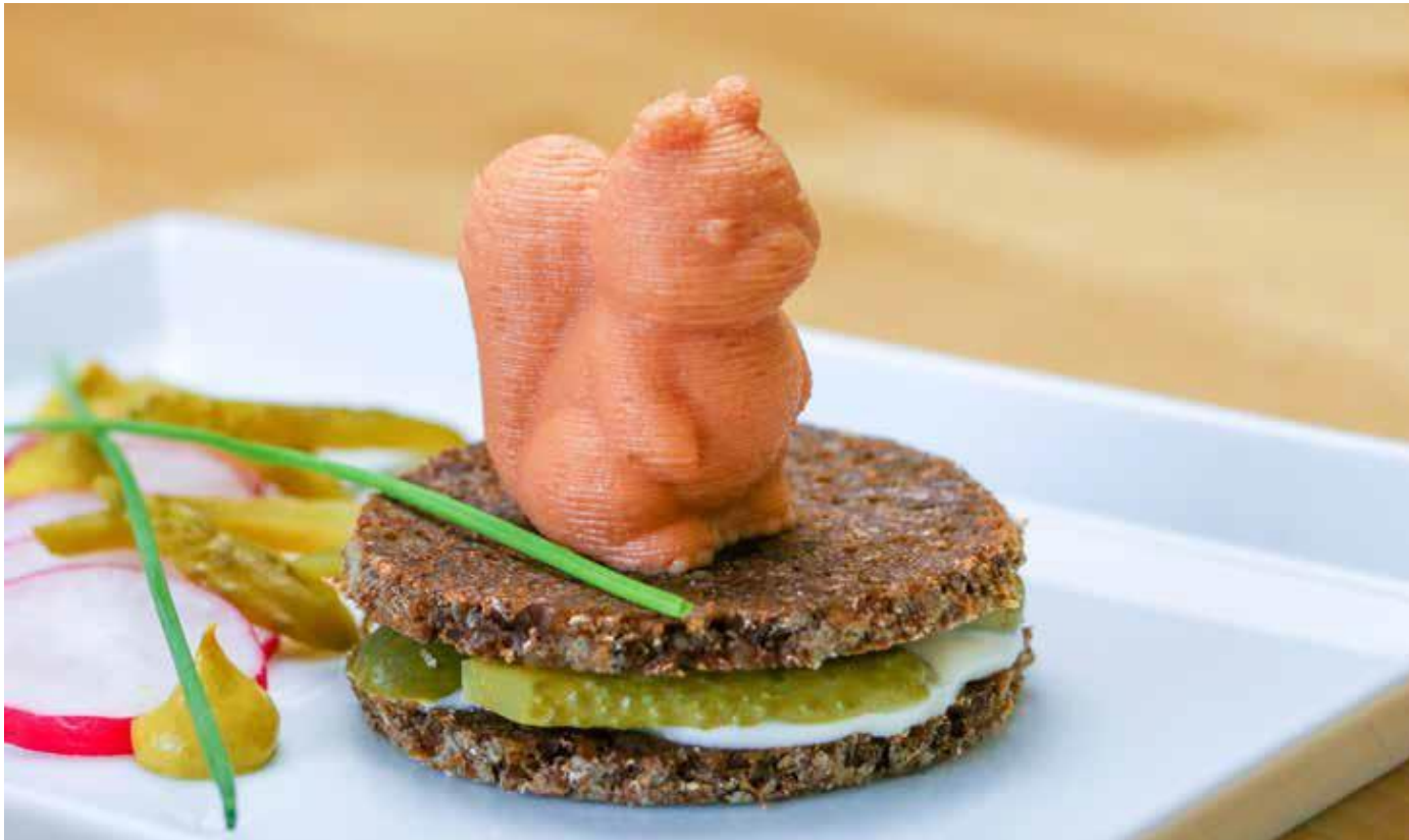
Párková veverička, špecialita aj pre dospelých

Tajomstvo úspešných 3D potravinových výtvorov spočíva v správnej konzistencii a recepte, v kombinácii s nastaveniami.