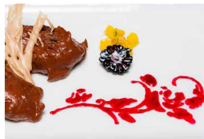
Tanierové tattoo s Procusini Cassis

Procusini Cassis - pyré z čiernych ríbezlí s vyváženou sladko-kyslou príchuťou.