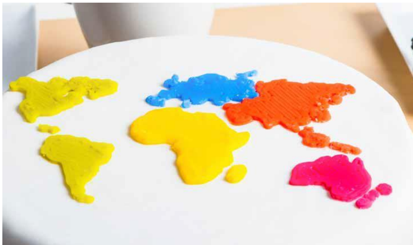
Procusini 3D Fondant - celý svet na koláči