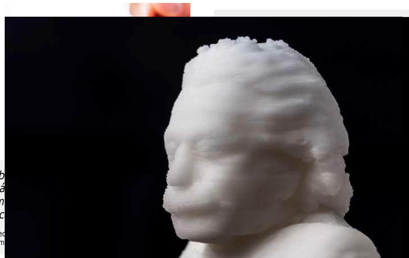
Busta Alberta Einsteina vyrobená s Procusini 3D Fondant

Procusini je vaša alternatívna možnosť, ako si pomôcť pri kreatívnom dekorovaní zákuskov.