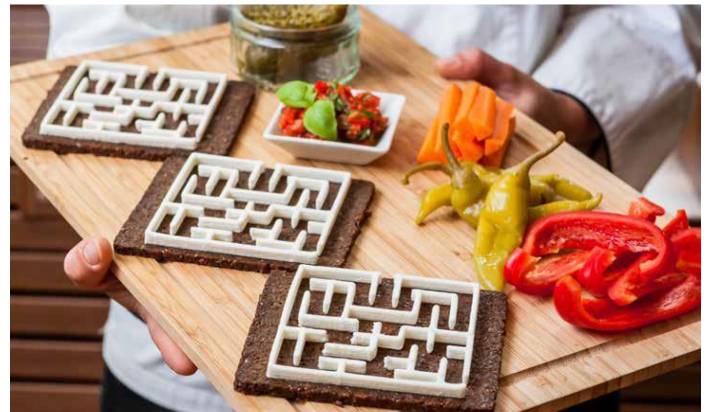
Bludisko z čerstvého kozieho syra ako vydarený snack