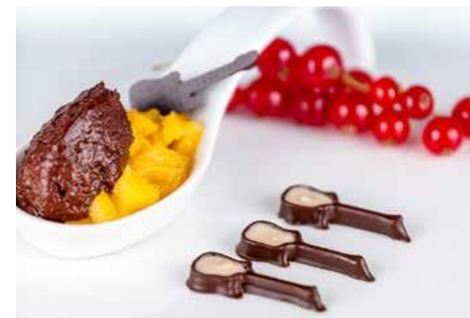
Plnené mini pralinky na dezerty

Neuveriteľných 84 originálnych čoko- gitár len za 93 minút. S Procusini 3.0 Dual môžete vyrobiť 84 čok-gitár len za 47 min.