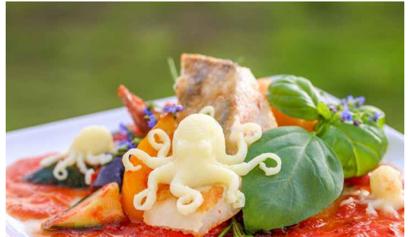
Ozdobné predjedlo – Chobotnica zo zemiakovej kaše na filete zo zubáča a ratatouille

Aby ste sa vyhli hrudkám, pretlačte masu cez jemné sito.