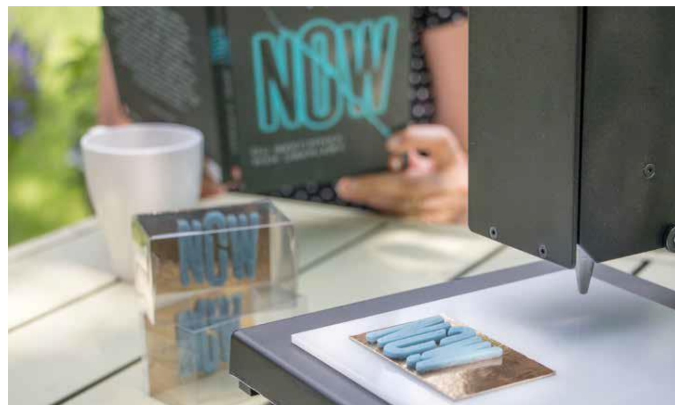
Chutné logo, atraktívne zabalené, a udalosť bude nezabudnutelnou spomienkou

- Až do 10 kusov „NOW“ logo za 30 minút s Procusini 3.0 Dual - S Procusini 3D Marzipan náplňou môžete vyrobiť až do 24 kusov „NOW“ logo