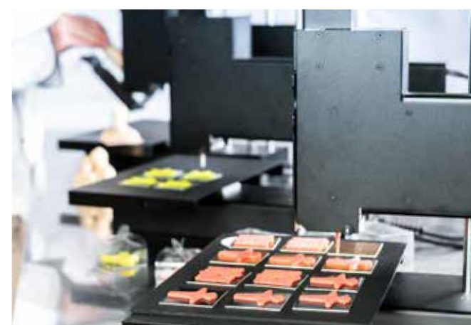
Výroba rozličných vzoriek

Dostupné vo farbách natural, žltá, červená, zelená a modrá.