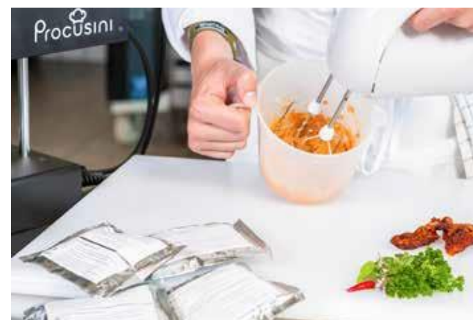
S Procusini 3D Pasta čerstvo zmixované len za 3 minúty

Hľadisko zábavy tiež dáva hostovi pocit, že v kuchyni plníme jeho/jej veľmi individuálne potreby.