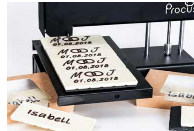
Individuálne označovanie čokoládových tabuliek

Jemné, drobné detaily sú presne to, čo ma ako hosta prekvapí a uchváti.