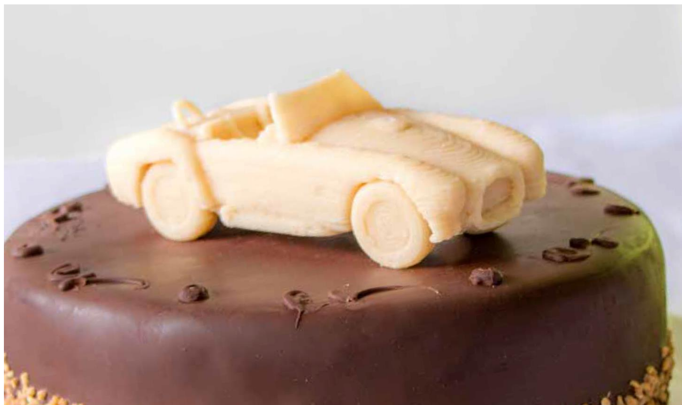
Sny zákazníkov, ktoré plní Procusini 3D Marzipan