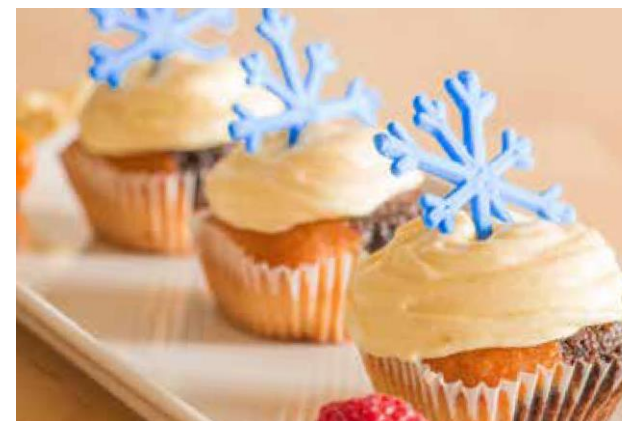
Procusini 3D Fondant - snehová vločka

Procusini 3D Fondant ponúka neuvěřiteľnú jemnosť kombinovanú so širokou škálou farieb v bielej, žltej, červenej, zelenej a modrej. Takto vám Procusini 3D Fondant umožňuje vyrobiť 3D busty a komplikované 3D tvary.