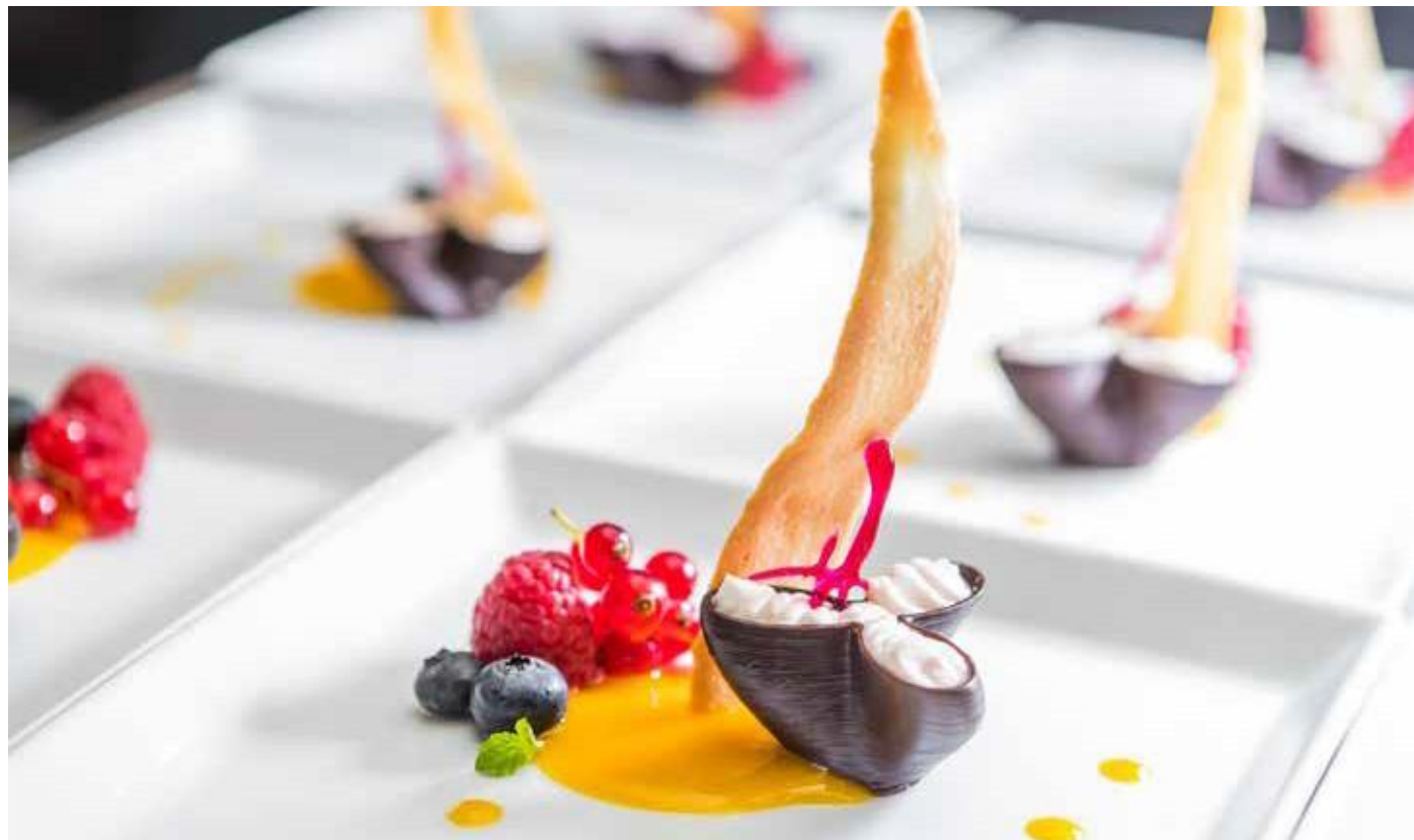
Procusini 3D Choco - kreácie plnené maslovým krémom