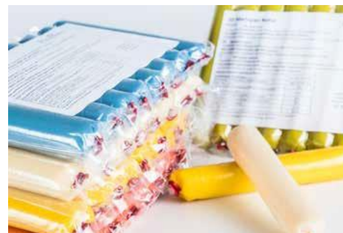
Procusini 3D Marzipan náplne

3D šablóna prichádza priamo od zákazníka. Po pár klikoch v Procusini Club-e vám 3D tlačiareň vymodeluje vzorky.